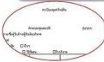
ตัวอย่างทะเบียนคุมทรัพย์สิน

ศาสตราภัณฑ์ - ลงทะเบียนคุมทรัพย์สินตามแบบที่ กวพ. กำหนด - ลงบัญชีในระบบ POLIS