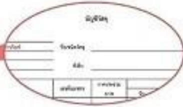
ตัวอย่างบัญชีวัสดุ