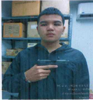
RTP 29107 MS