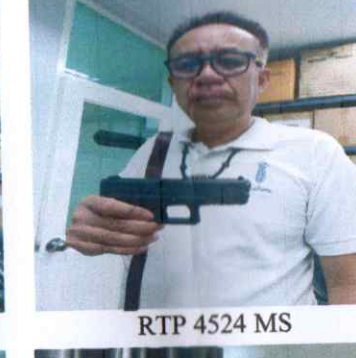
RTP 4524 MS