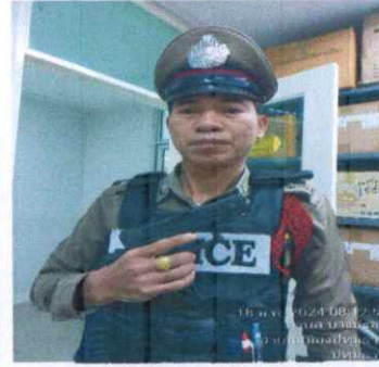
RTP 29102 MS