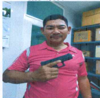
RTP 00494 (ไม่นำมาตรวจ)