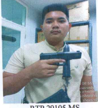
RTP 29105 MS