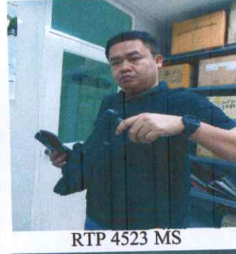
RTP 4523 MS