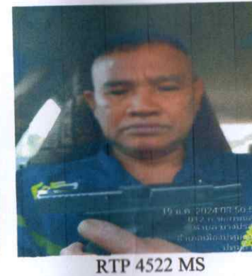
RTP 4522 MS