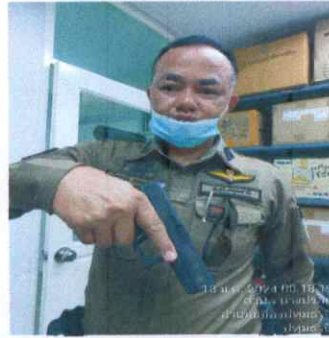
RTP 29103 MS