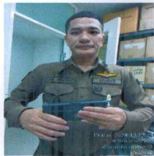
RTP 24046 MS