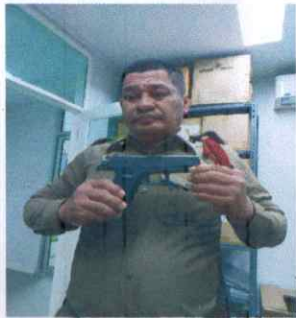
RTP 4433 MS