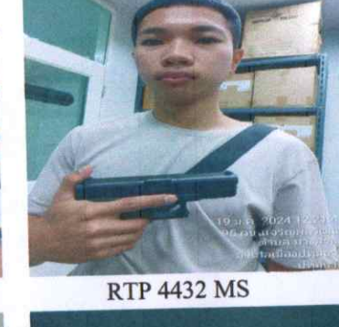
RTP 4432 MS