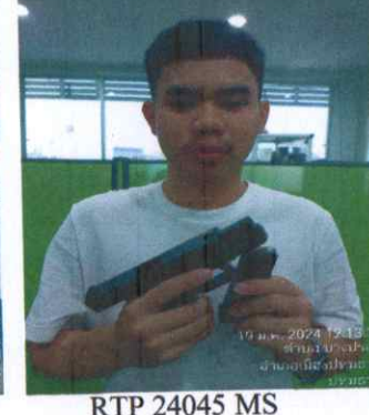
RTP 24045 MS