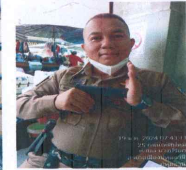
RTP 29101 MS