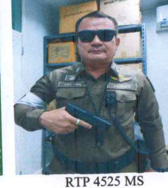
RTP 4525 MS