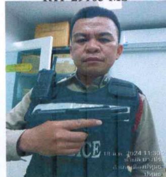
RTP 29104 MS