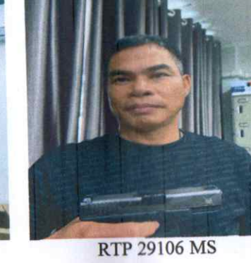
RTP 29106 MS